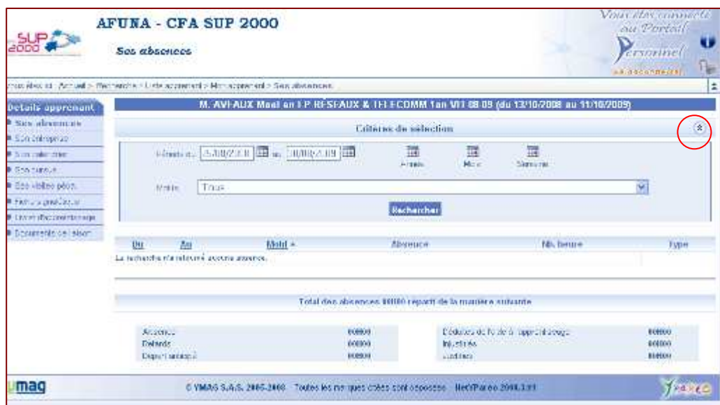
Écran 5: Suivi des absences

Vous pouvez trier les absences selon plusieurs critères (Année, mois, semaine, Motifs). Pour faire apparaître les critères de sélection, cliquer sur la double flèche.