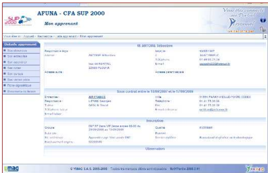
Écran 4: fiche de l'apprenant